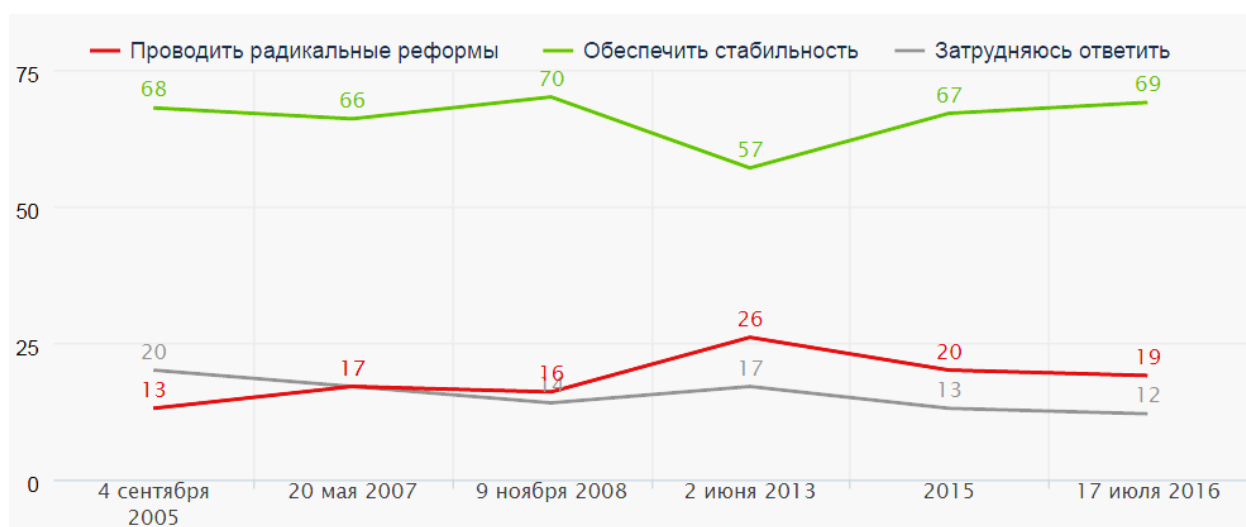
Рис. 2. Восприятие россиянами необходимости для современной власти осуществлять реформы или обеспечивать стабильность в России в 2005–2016 гг. [8]

Если обратить внимание на сам общественный запрос к власти относительно дальнейших действий, то на первый план выходит необходимость обеспечения стабильности, что отчетливо демонстрируется на графике, представленном на рис. 2.