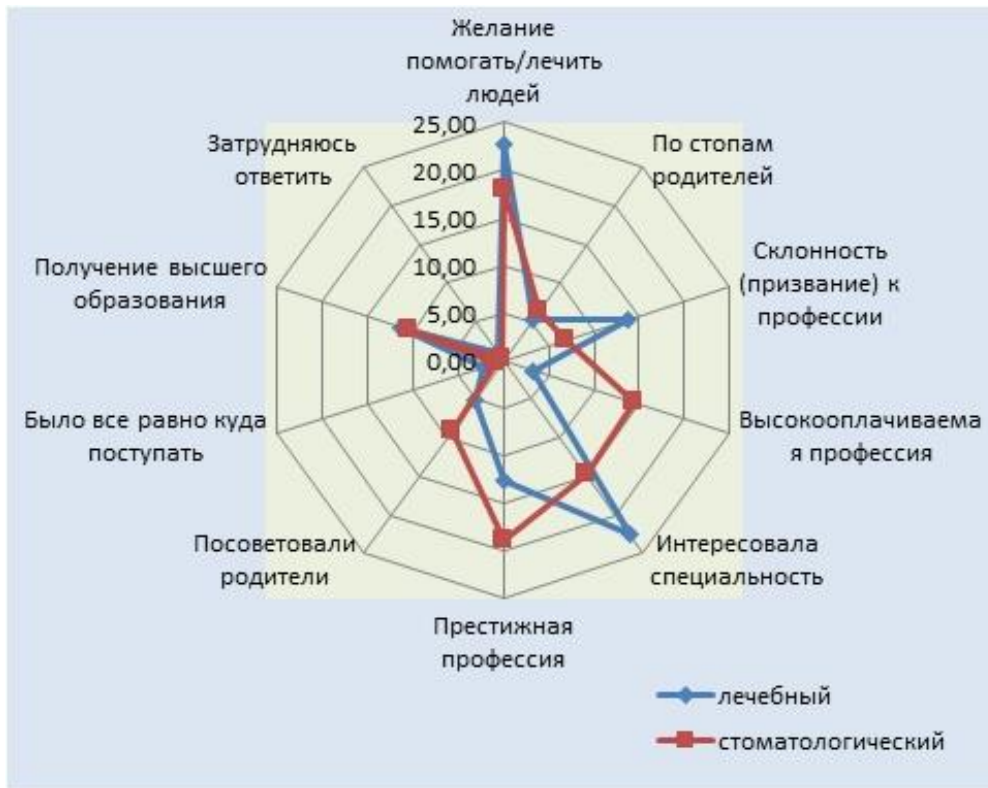
Рис. 1. Основные мотивы, повлиявшие на выбор профессии врача среди студентов ГБОУ ВО ДВГМУ (% от числа опрошенных)

в правильности выбора профессии врача-стоматолога, а число разочаровавшихся составило 8,02 \pm 2,13\% . Настораживает значительная доля студентов на обоих факультетах, затруднившихся ответить на поставленный вопрос ( 31,96 \pm 2,73 и 17,90 \pm 3,01\% соответственно) (табл. 1).