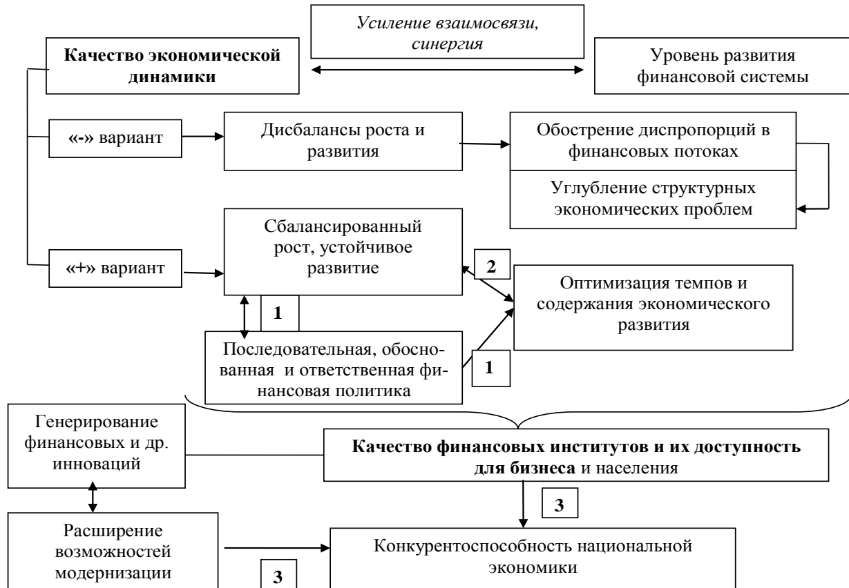
Рис. 2. Вариативность развития бизнес-среды в современных условиях [7]

В целом, содержательная интерпретация составляющих финансовый механизм развития МСП элементов, представлена в табл. 1.