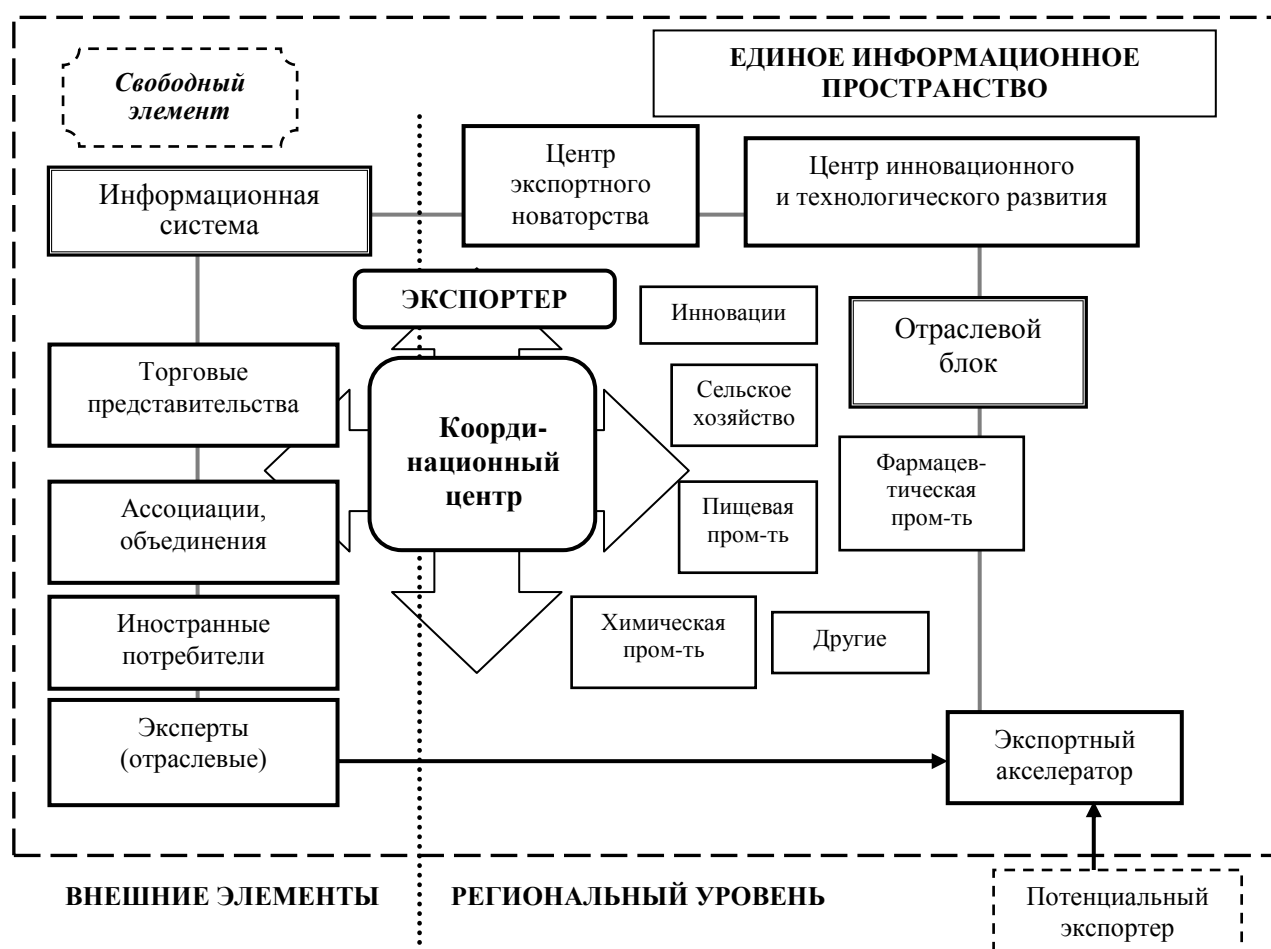
Рис. 3. Институциональный механизм повышения экспортного потенциала региона

Кроме того, в рамках единой информационной системы регион одновременно получает возможность создать положительный имидж и обеспечить высокую узнаваемость региональных брендов. На сегодняшний день, как бы ни конкурировали между собой регионы, иностранные потребители воспринимают Россию несколько иначе и делят ее на укрупненные территориальные зоны, такие как Сибирь, Восточная Россия, Центральная Россия, Москва (для некоторых иностранных потребителей Москва вообще является едва ли не единственным ориентиром) и т.д. Для региона в сложившихся условиях встает важнейшая задача: заявить о себе на мировой арене. Открытая информационная система может в существенной степени заменить или, по крайней мере, дополнить такие дорогостоящие и трудоемкие методы привлечения иностранных потребителей и демонстрации региональной продукции как национальные и международные выставки и ярмарки.