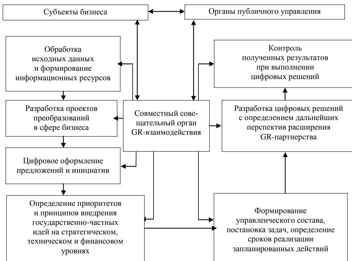
Рис. 2. Деятельность совещательного органа, обеспечивающего реализацию GR-менеджмента

Одним из конструктивных решений в сфере повышения уровня эффективности GR-взаимосвязей выступает создание совещательного органа при администрации региона или муниципального образования, состоящего из представителей бизнес-сообщества и структурных подразделений органов публичной власти. На основе применяемых цифровых технологий данный совещательный орган способен функционировать следующим образом (рис. 2).