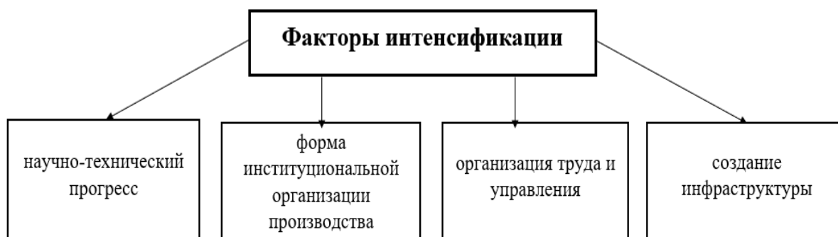
Рис. 1 Основные факторы интенсификации

При комплексном использовании факторов интенсификации градообразующего предприятия снизится стоимость единицы производимой продукции и трудоемкости производства, при этом будет обеспечиваться рост эффективности производства. Ключевые факторы интенсификации показаны на рис. 1.