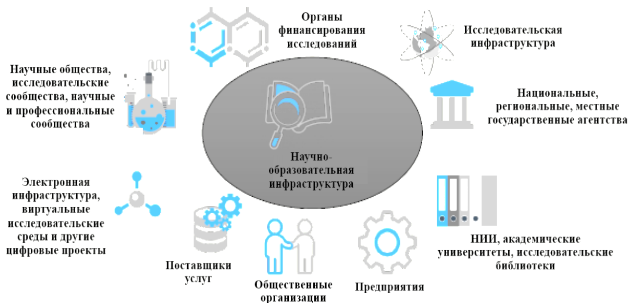
Рис. 2. Научно-образовательная инфраструктура

Составляющими, которые формируют научно-образовательную инфраструктуру, являются: здания и сооружения, музеи, библиотеки, лаборатории, микроскопы и телескопы, сенсоры, прочее лабораторное оборудование и т.д. В более расширенном виде она включает в себя помимо непосредственно институтов, относящихся к образовательной и научной сфере, также учреждения из государственного и финансового сектора, общественные организации, международные и глобальные агентства (см. рис. 2).