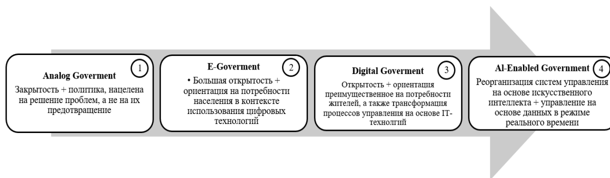
Рис. 1. Этапы цифровой зрелости систем государственного управления Fig. 1. Stages of digital maturity of public administration systems

Однако реализация технологических решений, предоставляемых вышеуказанными компаниями в первую очередь зависит от того, на каком этапе цифровой зрелости находится система государственного управления того или иного государства (рис. 1) 2 .